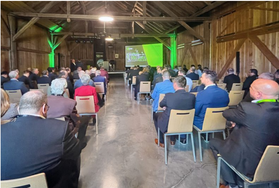
140 Gäste folgten der Einladung.