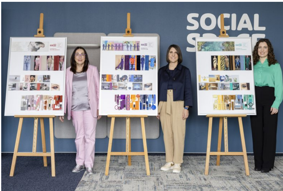
Das Designmanagementteam bei der Vorstellung der Trendfarben.

Unter dem Motto »Contribute to a world in peace« hat Folienspezialist Renolit seine diesjährige »Colour Road« mit den Trendfarben 2023/24 vorgestellt.